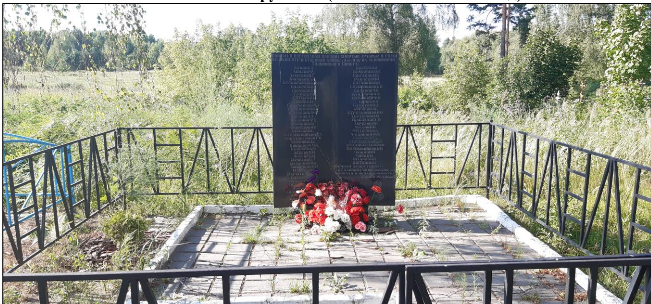
Видовая точка № 1. Вид на ОКН «Братская могила 57 советских воинов, погибших в 1941 и 1943 гг. в боях с немецко-фашистскими захватчиками» с южной стороны с близкого расстояния.