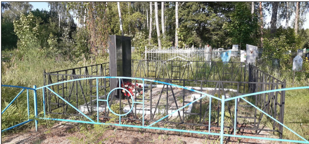
Видовая точка № 3. Вид на ОКН «Братская могила 57 советских воинов, погибших в 1941 и 1943 гг. в боях с немецко-фашистскими захватчиками» с юго-западной стороны.