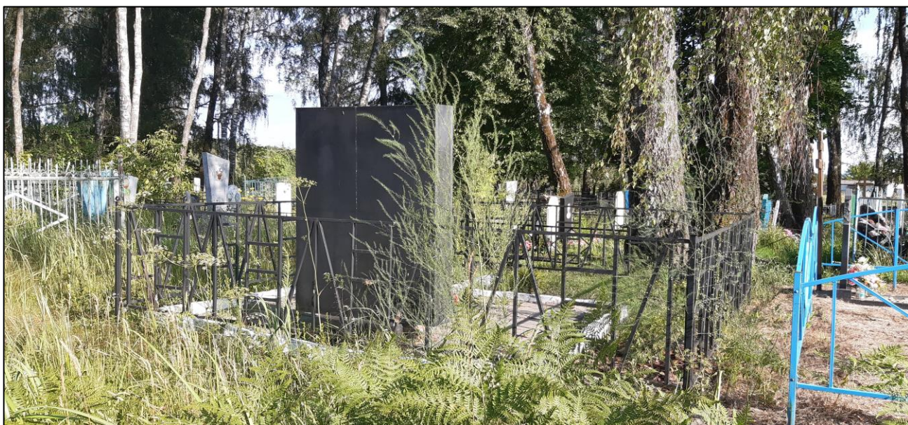
Видовая точка № 4. Вид на ОКН «Братская могила 57 советских воинов, погибших в 1941 и 1943 гг. в боях с немецко-фашистскими захватчиками» с северо-западной стороны.