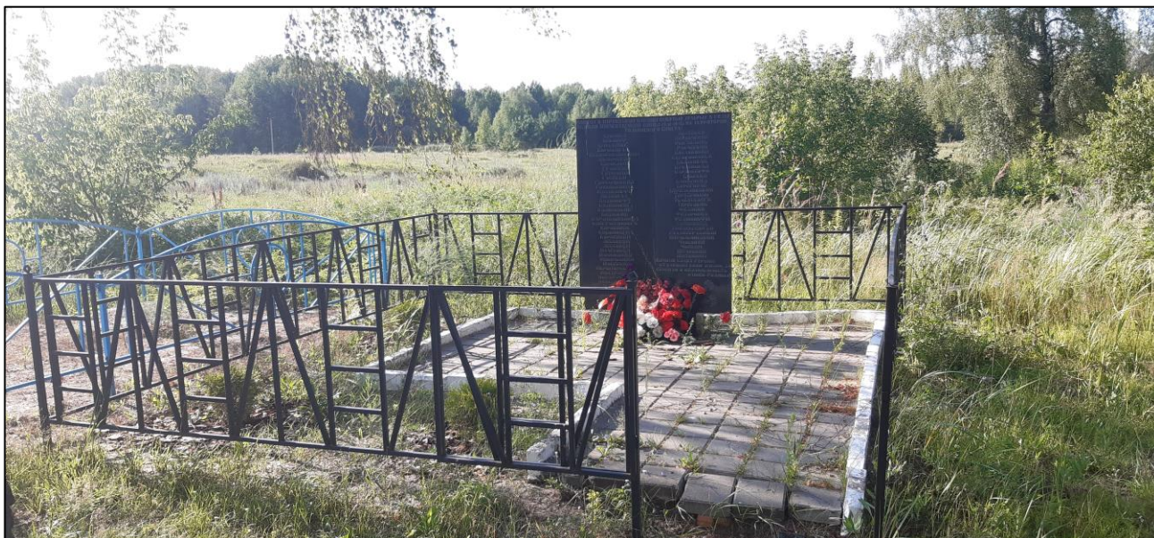
Видовая точка № 2. Общий вид на ОКН «Братская могила 57 советских воинов, погибших в 1941 и 1943 гг. в боях с немецко-фашистскими захватчиками» с юго-восточной стороны.